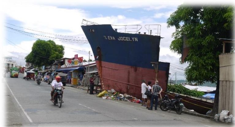
Jolanda: die Wucht des Taifuns

Von den Hilfsmaßnahmen, die die internationale Sathya Sai Organisation in Tacloban durchführte, erfuhr ich erste Einzelheiten beim europäischen Leitertreffen im Mai 2014 in