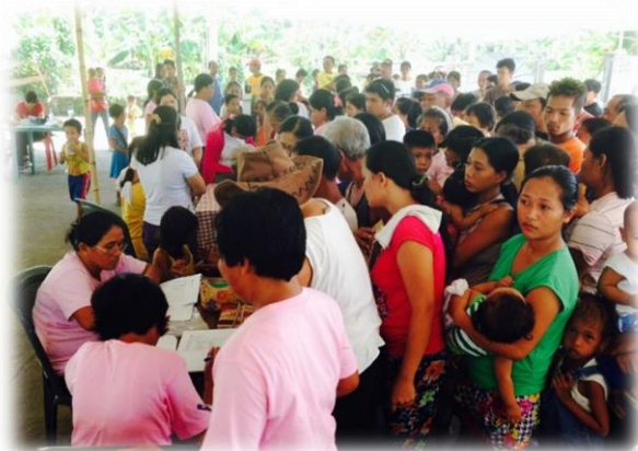
Ärzte arbeiten Tisch an Tisch

Am vierten Tag kamen wir nach Tigbao. Ein dreijähriges Mädchen lächelte mich an und zeigte mir den Zahn, der sie schmerzte. Sie bekam eine Spritze – sie lächelte – der Zahn wurde extrahiert – sie lächelte. Ich ging mit ihr zum Kinderarzt, damit sie auch die richtigen Medikamente bekam, sie schenkte mir zum Abschied ein Lächeln. Ein Mann, dem man die harte Arbeit ansah, veränderte sich nach der Spritze. Auf die Frage, was denn passiert sei, meinte er, dass der Schmerz endlich vorbei sei.