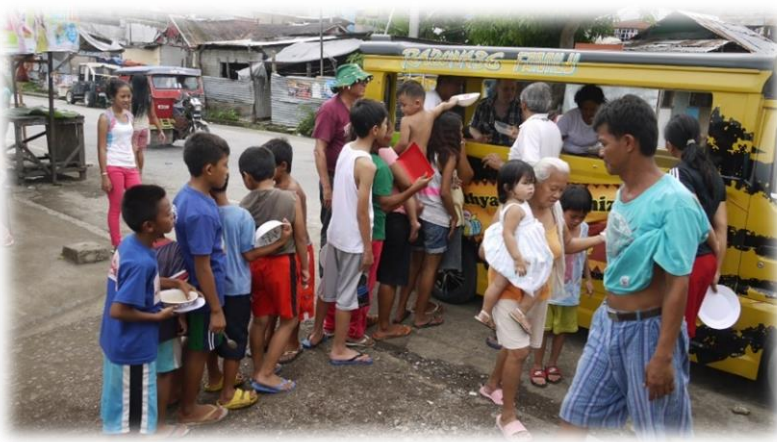
Im Armenviertel von Tacloban