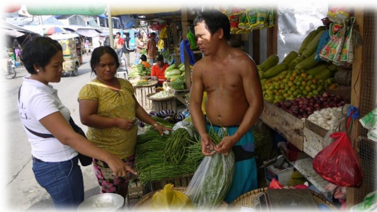
Einkaufen auf dem Markt

„Bangarays“, mit ihren notdürftigen Unterkünften unmittelbar an der Küste, wurden wir freudig aufgenommen, wenn wir junge und ältere Menschen ein- bis zweimal in der Woche mit einer gesunden Mahlzeit versorgten. Das war jedes Mal wieder ein eindruckliches Erlebnis. Und wenn wir uns vor unserem Hauseingang aufhielten, winkten uns die