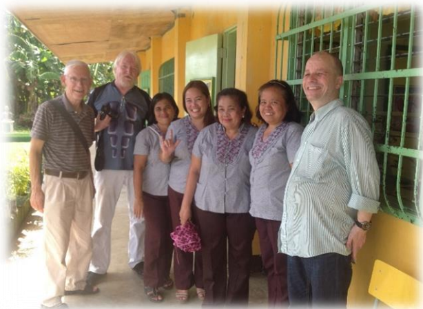
Die drei Freunde mit Helferinnen vor Ort

Das „Sai-Home“ war ein Haus nahe der Küste, das von der internationalen Sai Organisation angemietet worden war und in dem wir wohnten. Dort „schnibbelten“ wir täglich 1 bis 1½ Stunden das Gemüse, bevor es von unserer Köchin mit Reis oder Nudeln in großen Töpfen