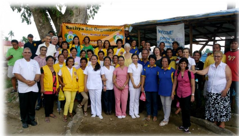
Das internationale Helferteam

solle, damit ich, wie ich es gewohnt bin, im Sitzen arbeiten konnte. Ich war sehr glücklich, als eine Stunde später der Stuhl eintraf.