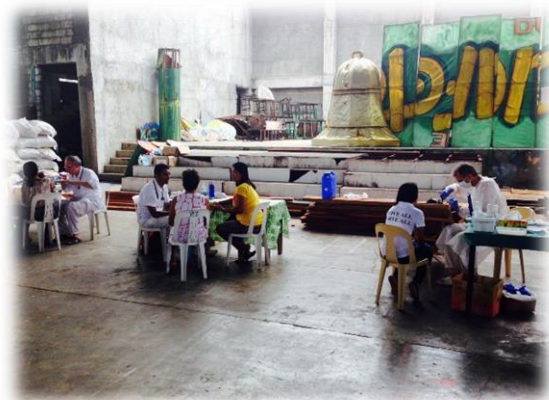
Patienten bei der Registrierung

Der erste Tag führte uns nach San Jose. In einem notdürftig reparierten Gebäude mit wenigen Wänden arbeiteten die Ärzte Tisch an Tisch vor den unter einer Plane wartenden Patienten. Es war für mich eine besondere Erfahrung, so unter Beobachtung meine Arbeit zu tun. Ich war jedoch so konzentriert, dass ich die Umgebung kaum wahrnahm. Die fremde Situation forderte mich, den Patienten wollte ich mit Liebe begegnen und ihnen helfen. Wie schon bei der Anreise fühlte ich mich auch jetzt bei meiner