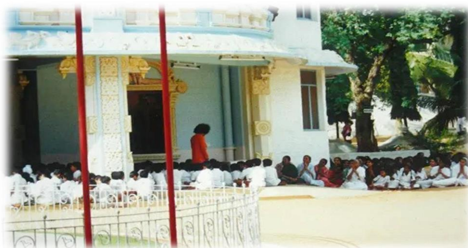
Gleich oberhalb von Swami befindet sich im ersten Stock der „Säulenbalkon“, der später noch in der Geschichte erwähnt wird (Pretti Bulsara).

„Du böser Junge! Setz dich hier neben mich! Du rennst zu viel herum und verstehst nicht einmal die grundlegenden Regeln von Disziplin.“