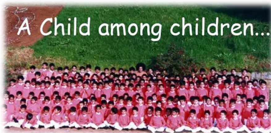
Swami mit den Kindern der Grundschule

Einer der schönsten Aspekte von Bhagawan Sri Sathya Sai Baba war die Art und Weise, wie Er mit Frauen und Männern, mit Kindern und Erwachsenen kommunizierte. Es waren ganz besonders die Kinder der Grundschule, die bei vielen Gelegenheiten das Kind in Ihm zum Vorschein brachten.