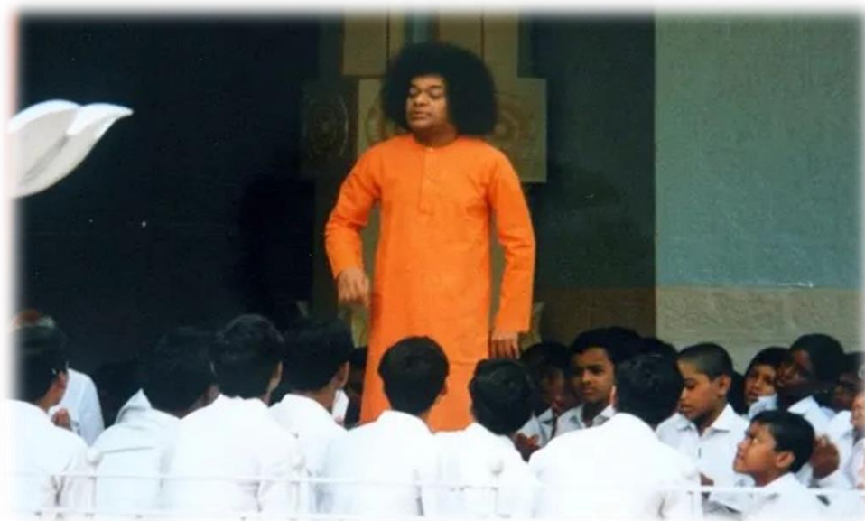
Swami wurde oft zu Mutter, Vater, Freund, Führer und Lehrer für die kleinen Kinder.

Also stand er von seinem Platz auf und ging auf Swami zu, um seine Beschwerde vorzutragen. Swami war gerade dabei, Seine Darshanrunde zu machen. Auf diesem perfekt und diszipliniert angeordneten Darshanplatz waren die Grundschullehrerinnen entsetzt, als sie sahen, wie der kleine Junge sich auf Swami zubewegte. Eine der Lehrerinnen stand auf und eilte, um den Jungen davon abzuhalten. Dennoch, bevor sie ihn erreichte, war er von der Frauenseite (wo die kleinen Kinder sitzen) hinüber auf die Männerseite gewechselt. Die Lehrerin blieb stehen, denn sie durfte nicht auf die Männerseite hinüber gehen. Der kleine Junge ging also ungestört weiter auf seiner „Reise zu Gott“!