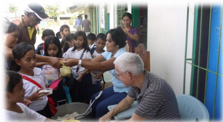
Essensausgabe in der San-Isidro-Schule

Bauarbeiter vor Ort konnten nicht anfangen, weil der notwendige Beton einfach nicht geliefert wurde. Man sagte uns, dass zuerst die Straßen fertig gestellt werden müssen. Wochenlang mussten wir abwarten, und erst beim letzten Besuch vor unserer Abreise im Dezember